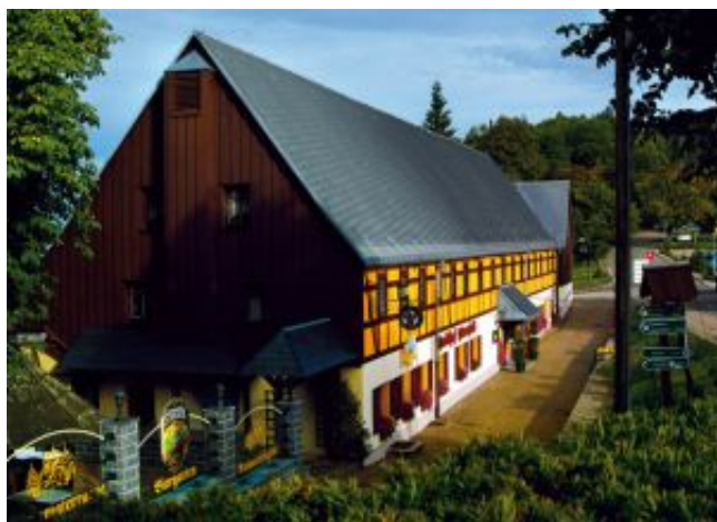
Hausansicht mit Biergarten

Buchautoren des „Kochbuch Silbernes Erzgebirge“